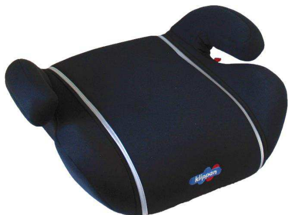
KLIPPAN CUSHION 22-36 kg / grp III